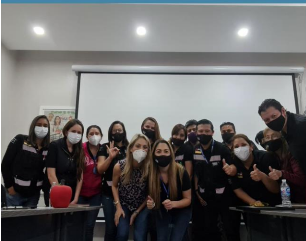
“La rueda de tu vida, como estoy y como quiero estar este 2021”