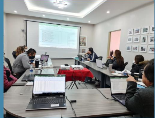
Buenas prácticas de higiene EQUIPO LOGÍSTICA Y ALMACÉN