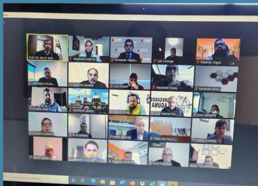
PACADI Políticas de acopio para distribución de alimento con Bancos hermanos