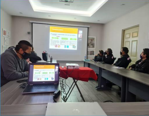
Tablas dinámicas NUEVO SISTEMA BAMX SALTILLO